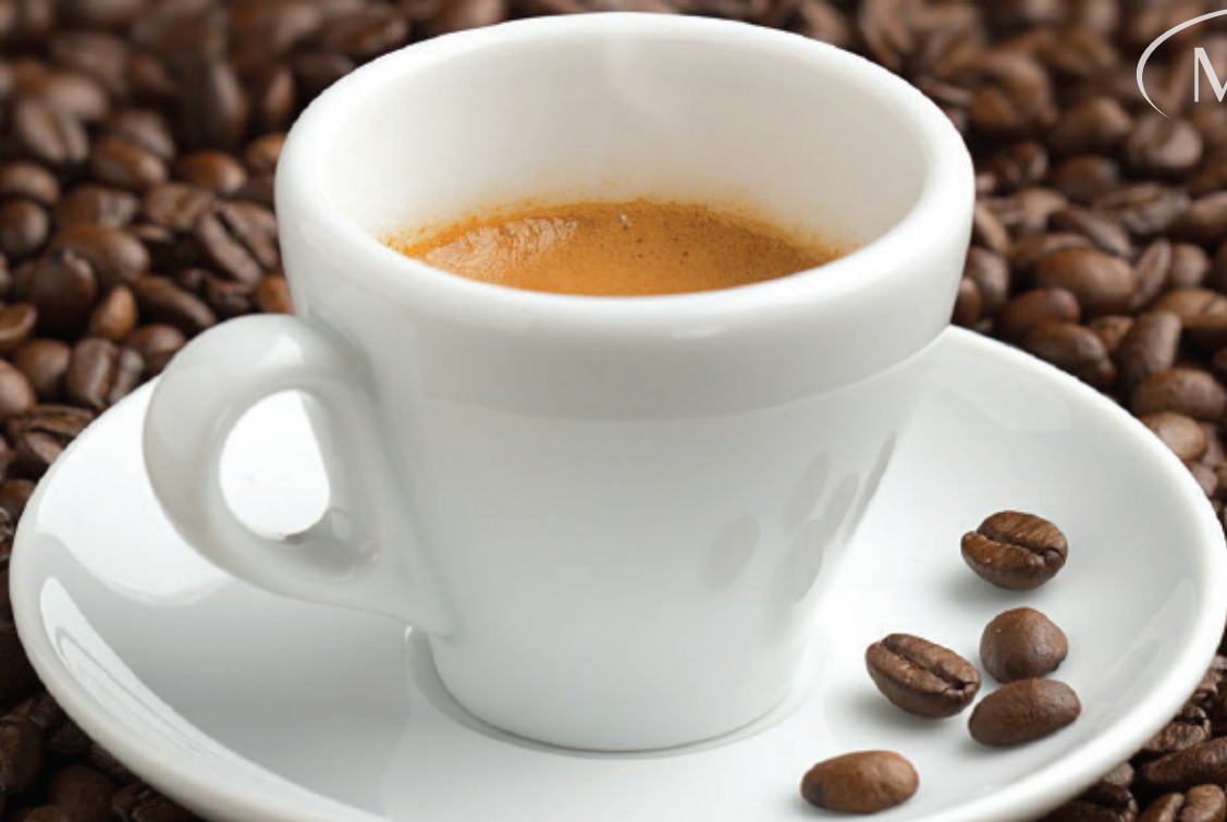
Molino Classic Palanca